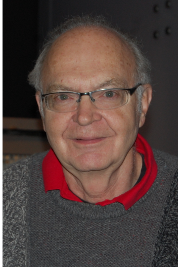
Figura 1: Donald Knutt

El creador de \text{T}_{\text{E}}\text{X} fue Donald Knutt y el de \text{L}^{\text{A}}\text{T}_{\text{E}}\text{X} Leslie Lamport.